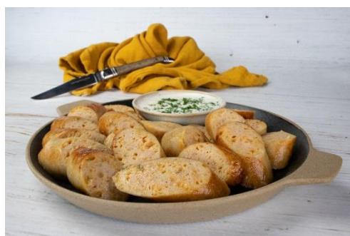
Worst kip Texas style gegaard